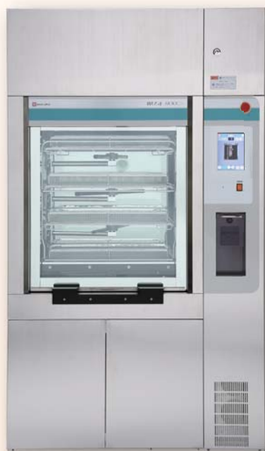
NEW サクラ自動ジェット式超音波洗淨装置 WUS II-3100DX シリーズ