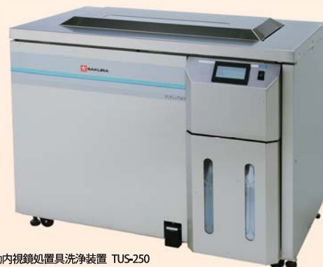
サクラ自動内視鏡処置具洗淨装置 TUS-250