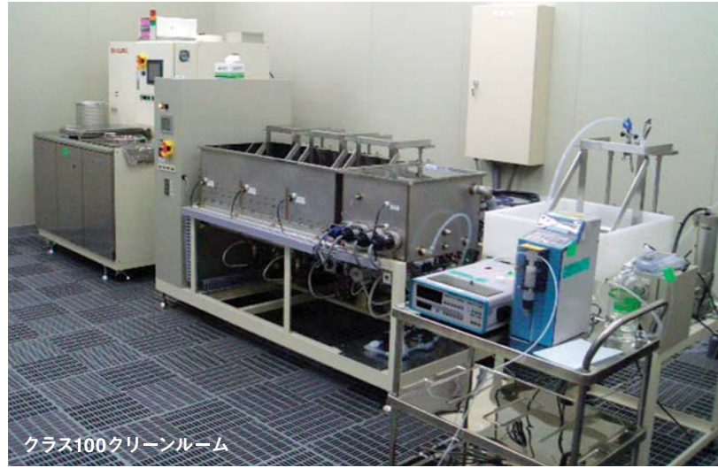
クラス100クリーンルーム

数々のテスト機、分析機器を取り揃え、洗浄テストを迅速に対応します。 まずは洗浄結果をお客さまの目でお確かめください。